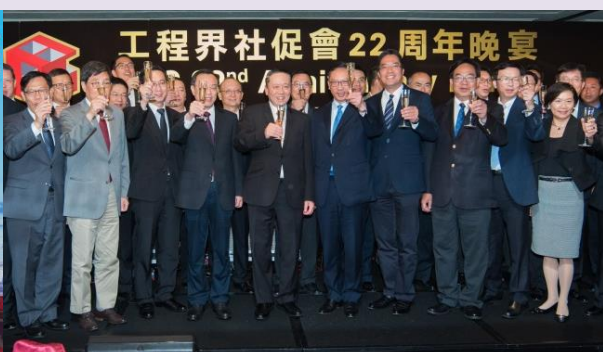
主席、顧問、理事與主要嘉賓祝酒